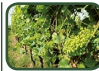
Acino grano di pepe